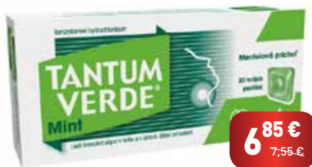
TANTUM VERDE® Mint, 20 tvrdých pastiliek

V akcii aj iné príchuťe TANTUM VERDE®, 20 tvrdých pastiliek