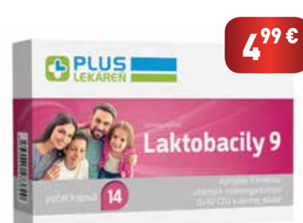
Laktobacily 9, 14 cps

Výživový doplnok je komplexom 9 kmeňov laktobacilov a bifidobaktérií . V dennej dávke obsahuje 15 miliárd vitálnych mikroorganizmov.