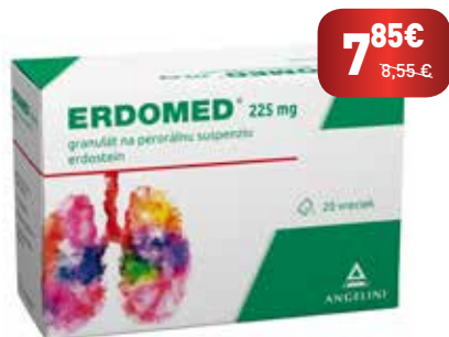
ERDOMED® 225 mg, 20 vreciek

ERDOMED® je osvedčený liek na ochorenia horných aj dolných dýchacích ciest .