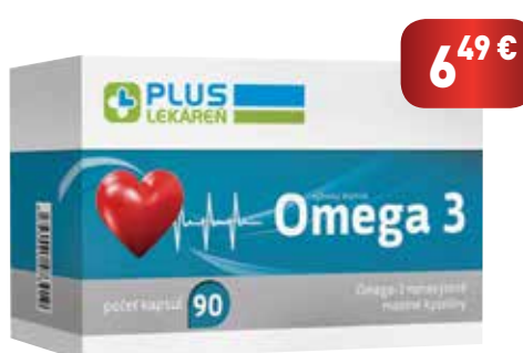
Omega 3, 90 cps

DHA prispieva k udržaniu správneho funkcie mozgu a dobrého zraku , spoločne s EPA prispievajú i k správneho funkcii srdca , pričom priaznivý účinok sa dosiahne pri dennom prijme 250 mg EPA a DHA.