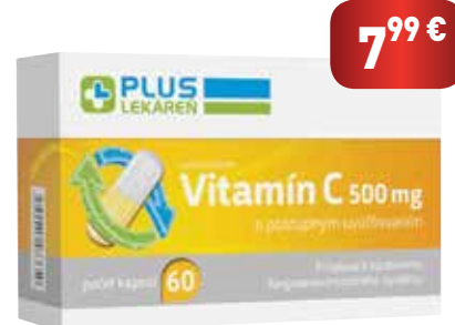
Vitamín C 500 mg, 60 cps

Vitamín C s postupným uvoľňovaním. Vitamín C prispieva k normálnej funkcii imunitného systému , k znižovaniu miery únavy a vyčerpania a k normálnej tvorbe kolagénu . Taktiež prispieva k ochrane buniek pred oxidačným stresom a zvyšuje vstrebávanie železa.