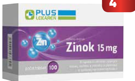
Zinok 15 mg, 100 tbl

Zinok prispieva k udržaniu zdravých vlasov, nechťov a pokožky, k plodnosti a správnej reprodukčnej funkcii . Napomáha k správneho fungovaniu imunitného systému, k normálnej syntéze DNA, deleniu buniek a ich ochrane pred oxidačným stresom.