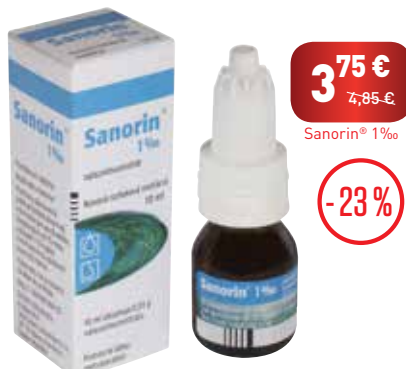
Sanorin® 1‰, nosová roztoková instilácia, 10 ml