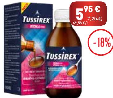
TUSSIREX sirup, 120 ml

Lieky na vnútorné použitie. Obsahujú N-acetylcysteín.