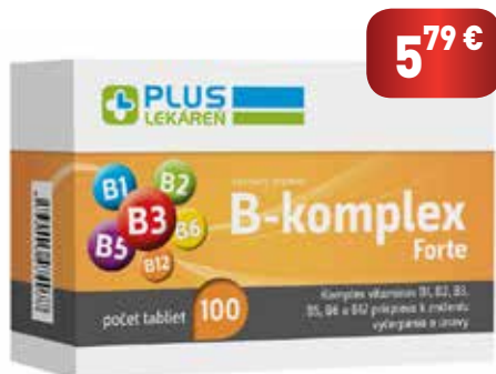
B-komplex Forte, 100 tbl

Komplex vitamínov B1, B2, B3, B5, B6 a B12 prispieva k znižovaniu vyčerpania a únavy a k správneho fungovaniu nervového systému . Obsahuje aj biotín a kyselinu listovú.