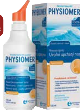
PHYSIOMER nosový sprej Hypertonický, 135 ml