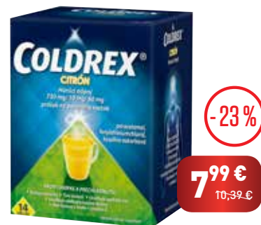
COLDREX Horúci nápoj Citrón, 14 vreciek V akcii aj iné lieky COLDREX

Rýchlo uľaví od príznakov chrípky a prechladnutia.