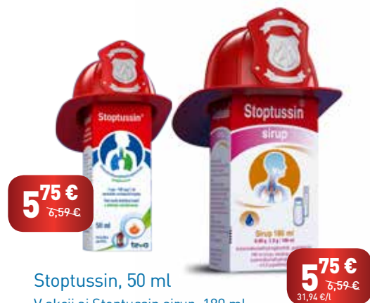
Stoptussin, 50 ml V akcii aj Stoptussin sirup, 180 ml

V akcii aj TUSSIREX Junior sirup, 120 ml Zdravotnícke pomôcky.