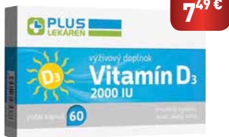
Vitamín D3 2000 IU, 60 cps

Výživový doplnok s obsahom vitamínu D3. Vitamín D prispieva: