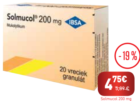
Solmucol 200 mg, 20 vrecúšok V akcii aj Solmucol 90, sirup 90 ml

Solmucol lieči ochorenia horných a dolných dýchacích ciest . Rozpúšťa hlieny v dýchacích cestách a uľahčuje vykašliavanie. Pôsobí antioxidačne a protizápalovo. Neobsahuje cukor, laktózu, ani lepek.